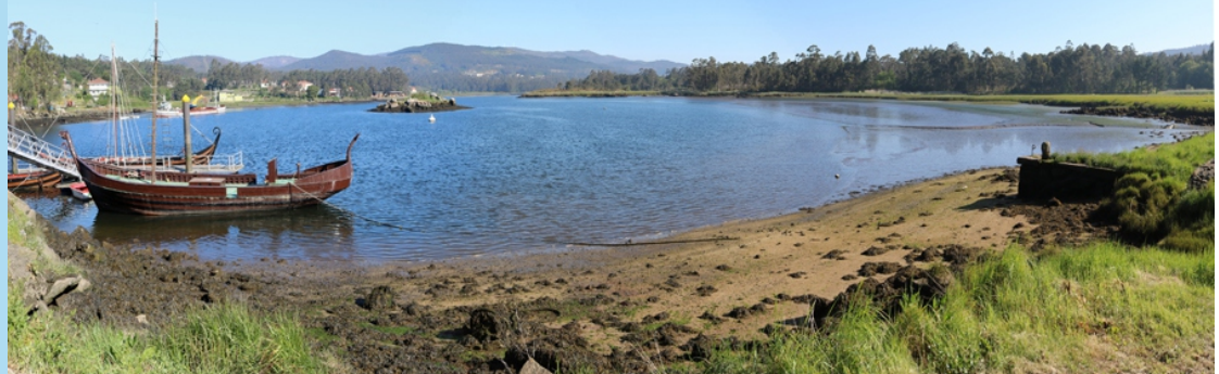
Panorámica do Ulla, cos barcos da festa viquinga.

Propoñemos un roteiro case chan, ben acondicionado, no que alternan pistas de terra e pasarelas de madeira, para camiñar un par de horas, pola beira do río. Un roteiro de interese xeográfico –porque no traxecto percorremos a zona na que o Río Ulla se transforma en Ría de Arousa–; biolóxico natural -camiñando por xunqueiras, carrizais e áreas palustres (zonas de vexetación especialmente adaptada aos asolagamentos e aos cambios de salinidade) incluídas no LIC “Sistema fluvial Ulla-Deza”; etnográfico (muíños) e histórico (Torres do Oeste e ponte romana).