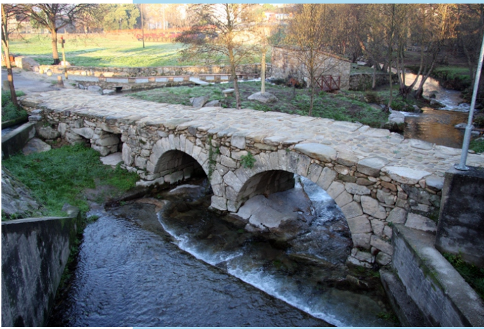
Ponte romana sobre o río Catoira