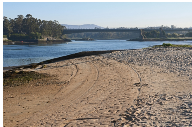
Praia fluvial no Ulla

Moitas son as razóns que nos poden levar a achegarnos a Catoira, un concello situado á beira do Ulla e do mar de Arousa e ao abrigo do Xiabre: a súa natureza e paisaxe, a súa historia, os valores etnográficos, as súas festas... Todo isto fai desta vila un bo lugar para pasar un día de lecer.