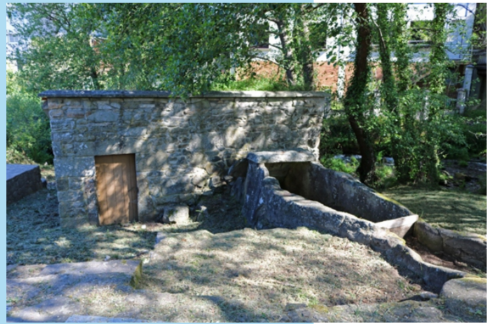
Muíño no río Catoira