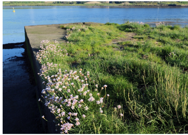
Herba de namorar