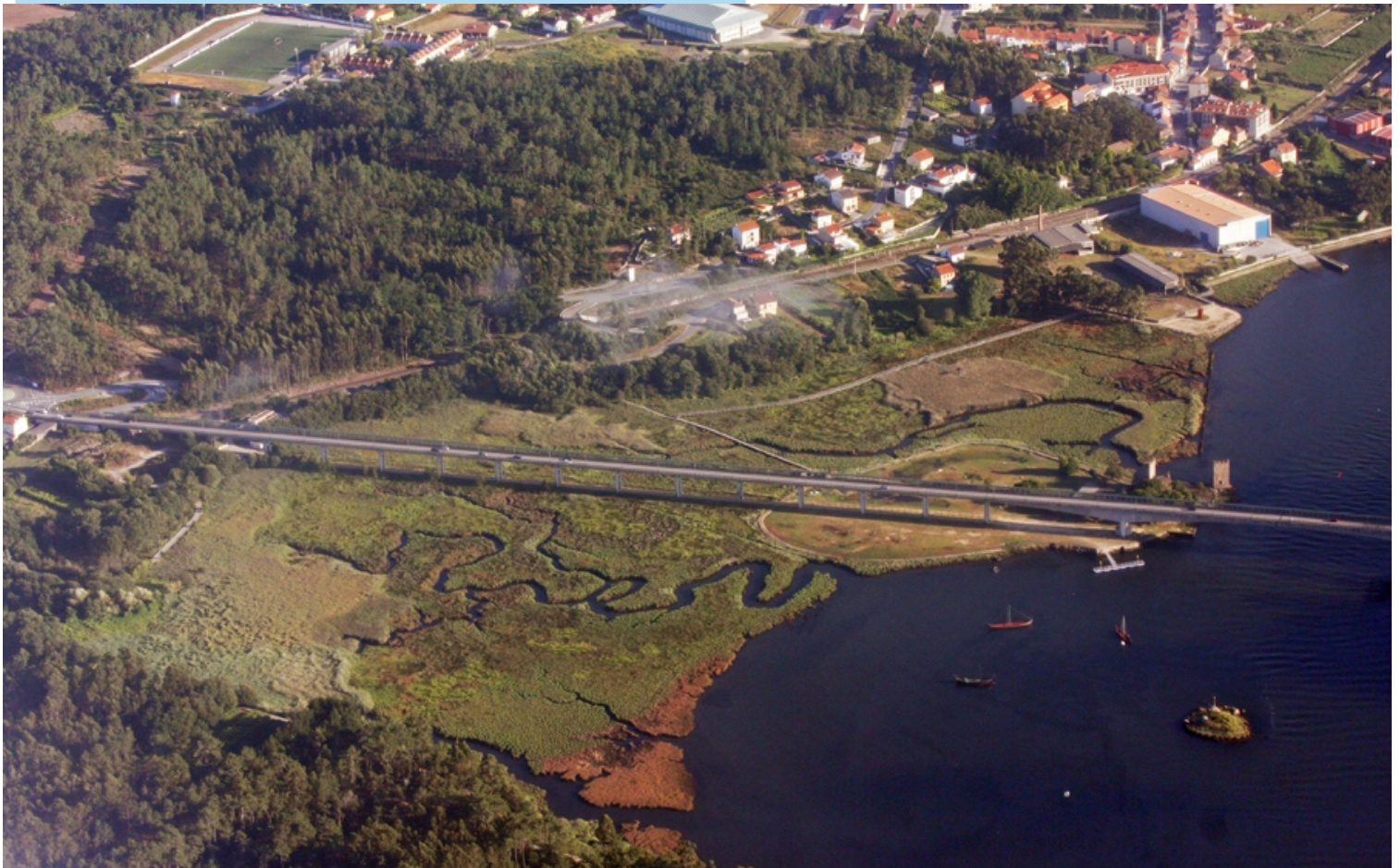
Vista aérea das marismas e as Torres do Oeste

No esteiro aséntase unha vexetación especialmente adaptada a un medio húmido e exposto a asolagamentos periódicos e a contínuos cambios de salinidade.