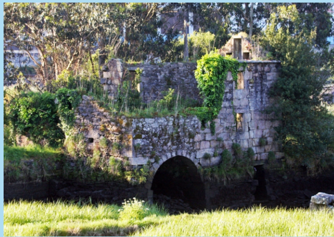
Muíño do Cura: aproveitaba a auga do río Catoira e das mareas.