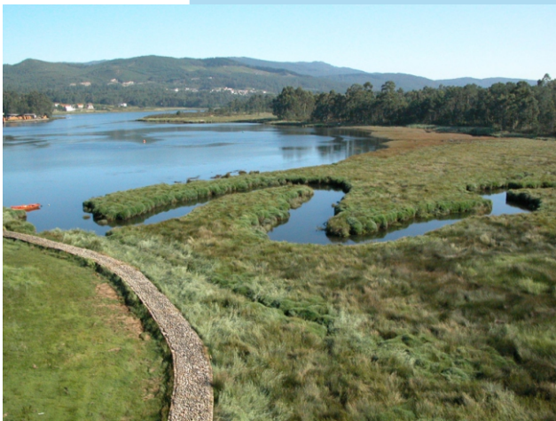
O esteiro do Ulla desde a ponte da estrada

Restos do forno dunha antiga telleira. As telleiras foron os xermos das industrias de cerámica para a construción que foron, ata hai poucos anos, os peares económicos da localidade.